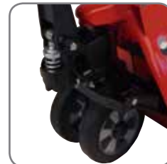
Hållbart och oljetätt hydraulsystem.