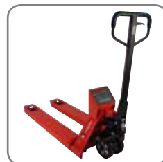
Robust, noggrann och lätt att använda överallt i verksamheten!

Fråga efter mer information eller besök www.logitrans.com