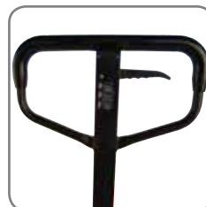
Gummibeläggningen på handtaget gör det behagligt att hålla i.