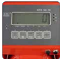
WSP 2200 har tara-, räkne- och nollställningsfunktion.