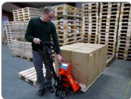
WSP 2200 transporterar och väger gods i ett och samma arbetsmoment.