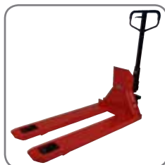
Noggrant vägningsresultat uppnås med fyra lastceller.