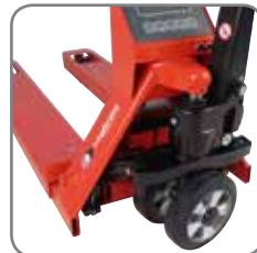
Pallvagnen kan svänga i 210° och säkerställer därigenom lätt manövrering i trånga utrymmen.