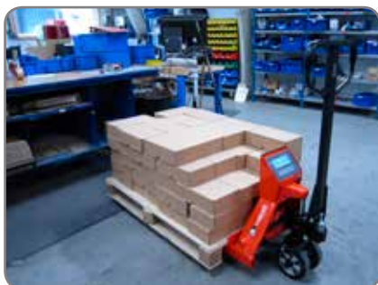
Ljud- eller ljusindikering när den önskade vikten är uppnådd.