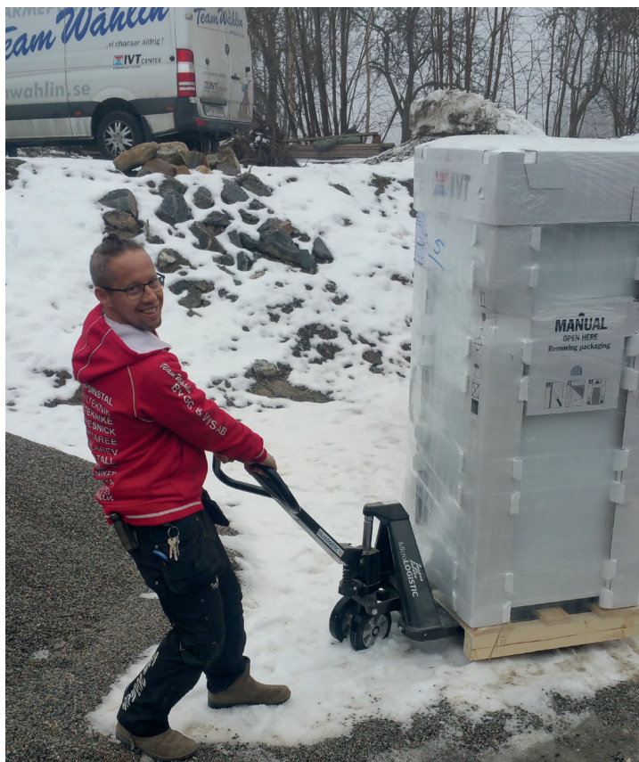
Cross Silent klarar även transport utomhus. Snö och grus - inga problem!

Hjulen är mycket skonsamma mot golvbeläggningen och möjliggör ljudlösa varuleveranser även i butiker med hårda klinkergolv, trösklar och skarvar.